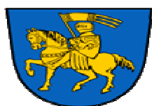
VILLE DE SCHWERIN