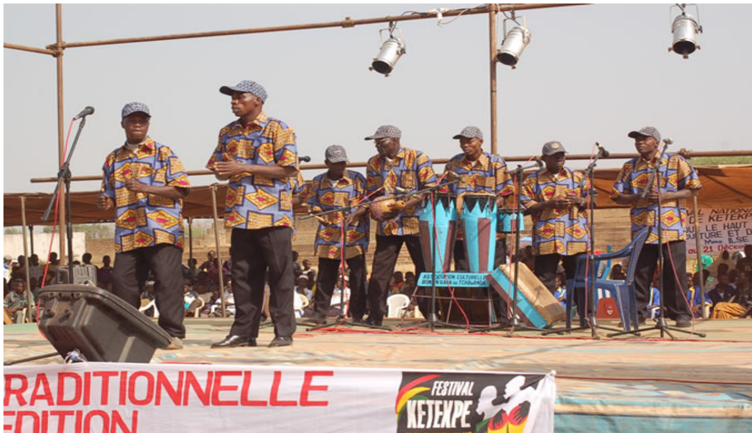
Le groupe Bo na Ngana, 1er lauréat de l'édition 2009